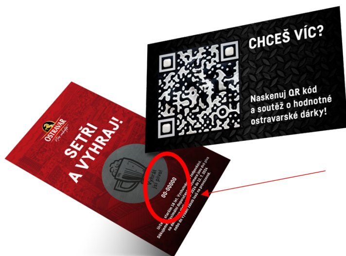
Ukázka 1 – umístění kódu na soutěžním losu