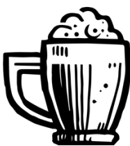
Ukázka 3 – čepované pivo Ostravar dle výběru hostinské provozovny