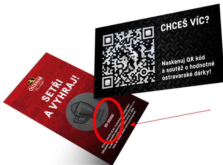
Ukázka 1 – umístění kódu na soutěžním losu